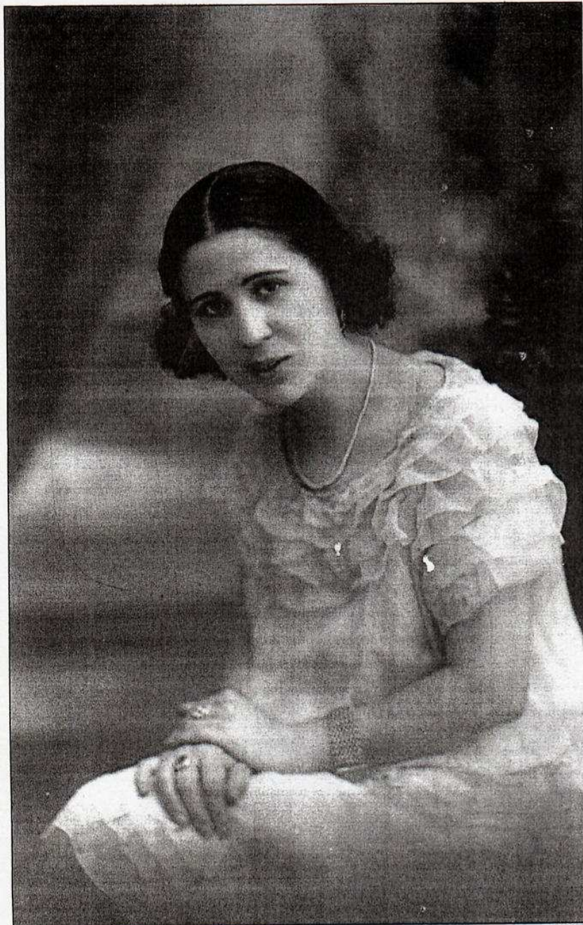
Cándida Pérez a l'època en què, amb cançons com 'Les caramelles', aconseguia la màxima popularitat